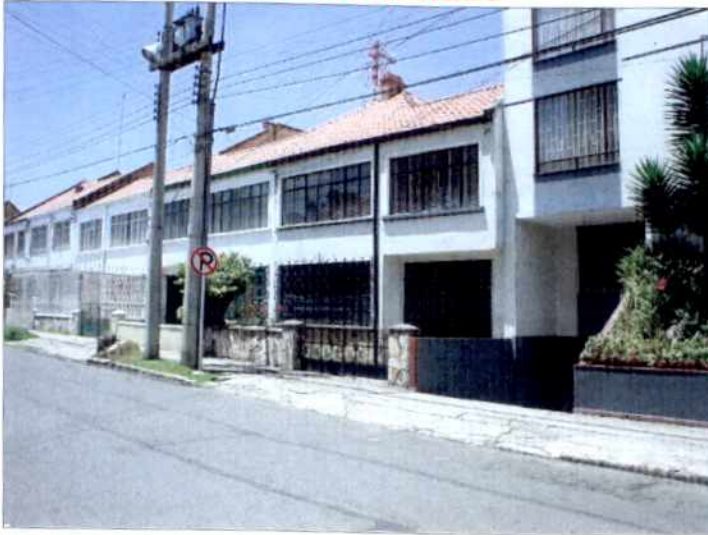
CRITERIOS DE CLASIFICACION